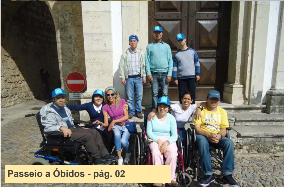
Passeio a Óbidos - pág. 02