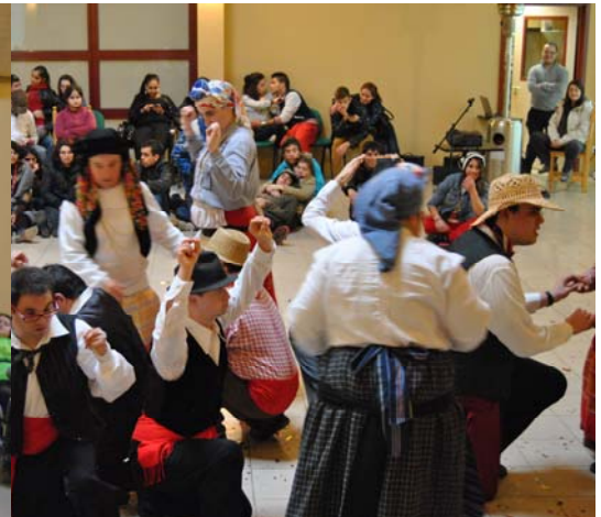
Dia do Formando - pág. 12