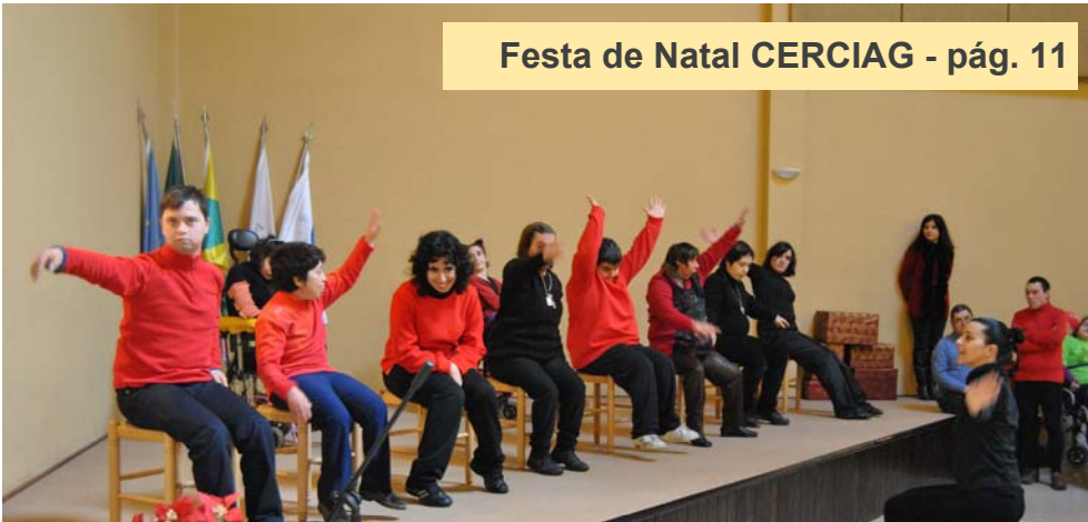
Festa de Natal CERCIAG - pág. 11

Boletim Informativo N.º 28 Dezembro, 2013