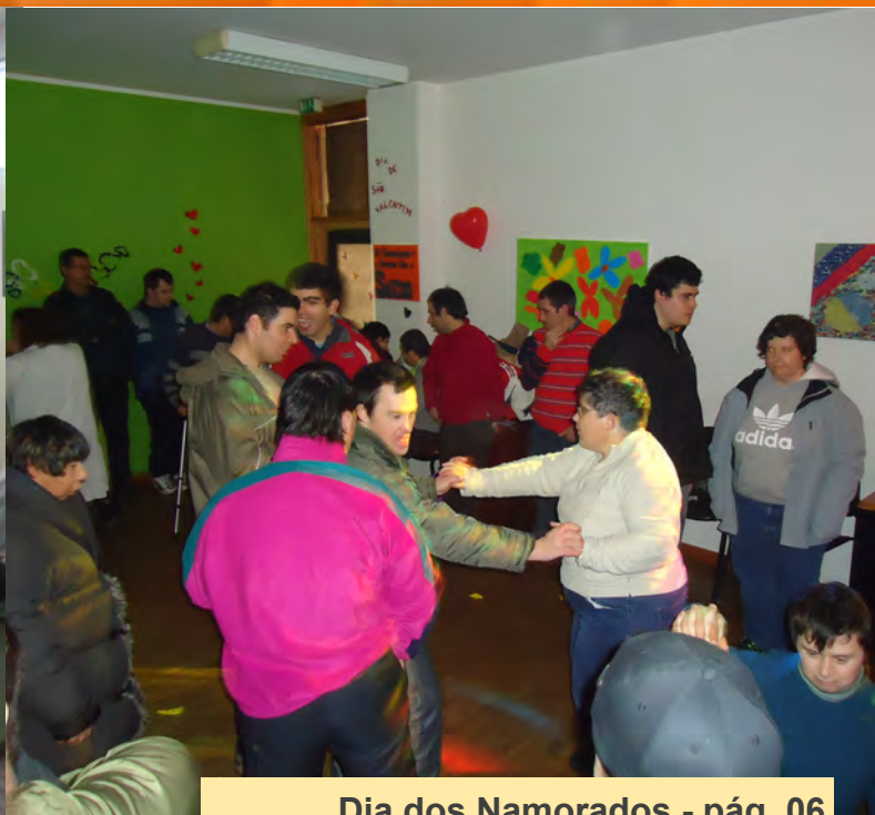
Dia dos Namorados - pág. 06