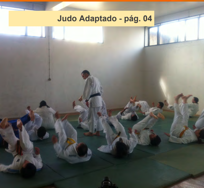
Judo Adaptado - pág. 04