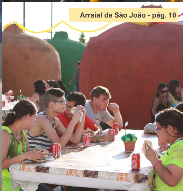
Arraial de São João - pág. 10