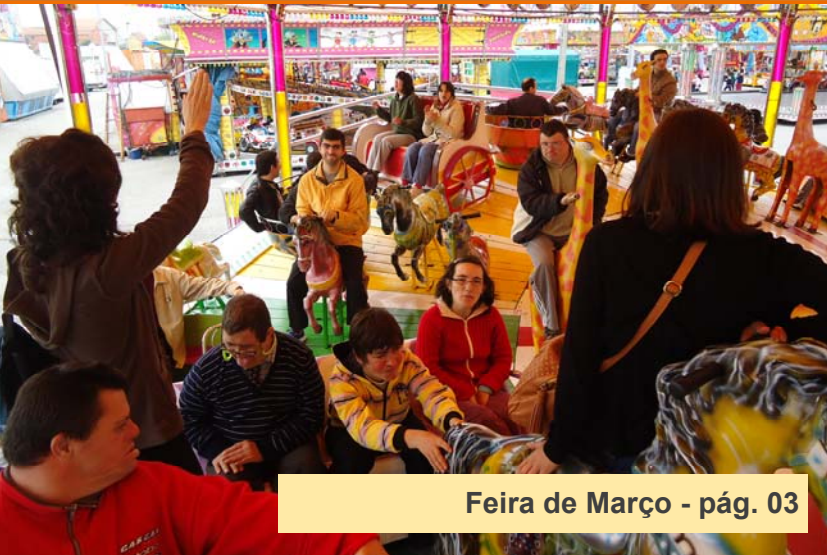
Feira de Março - pág. 03