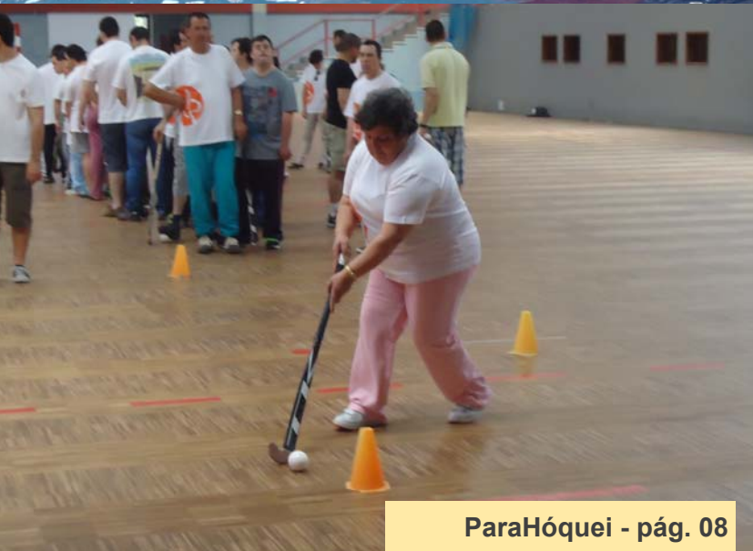
ParaHóquei - pág. 08