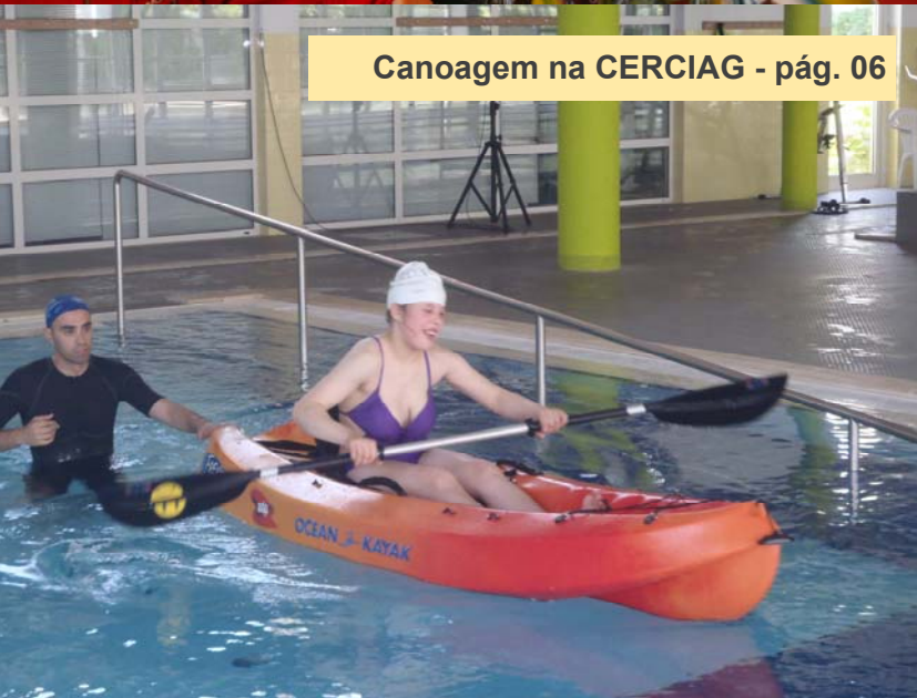
Canoagem na CERCIAG - pág. 06