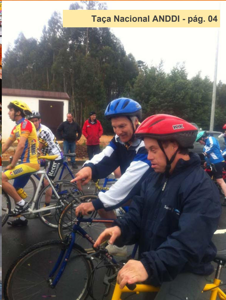
Taça Nacional ANDDI - pág. 04