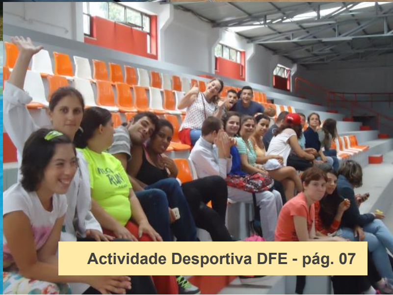
Actividade Desportiva DFE - pág. 07