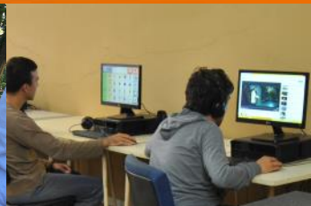
CERCIAG em Movimento - pág. 11