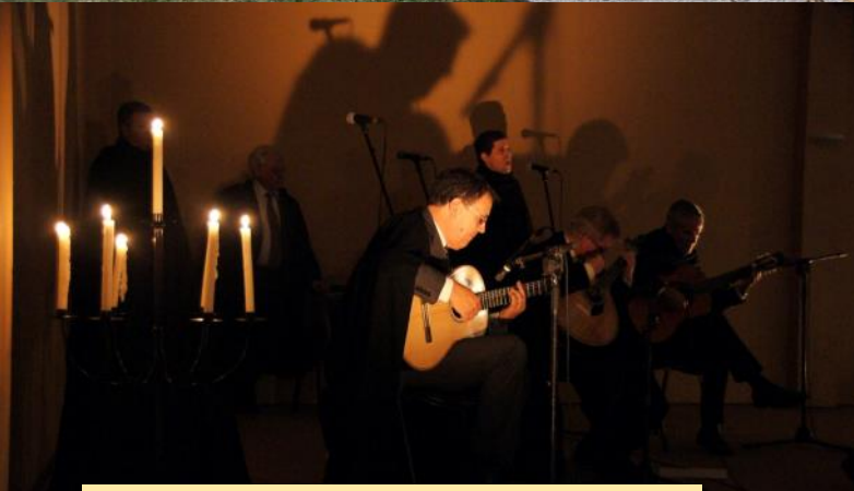
Jantar Fados Solidários - pág. 06