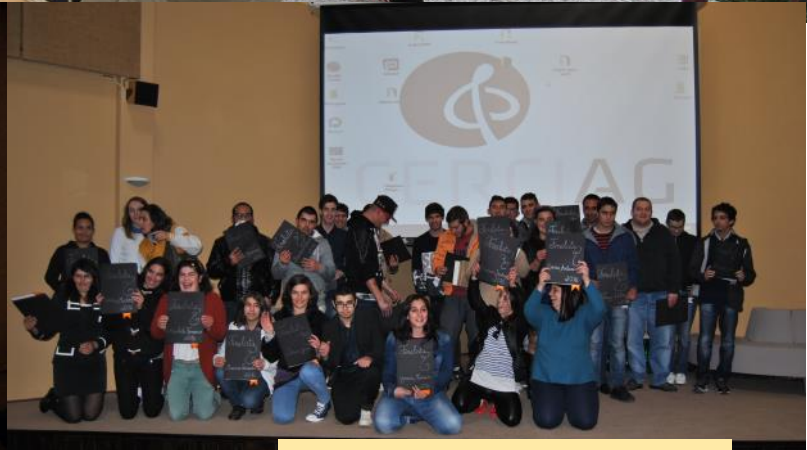
Dia do Formando - pág. 16