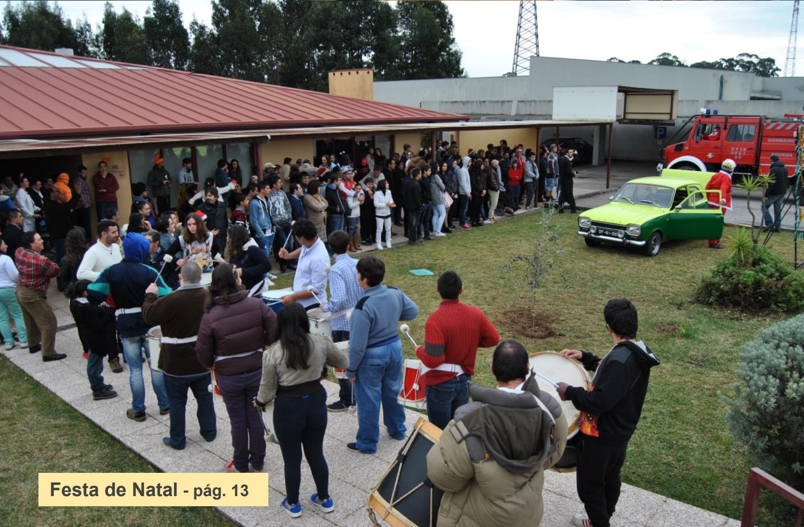
Festa de Natal - pág. 13